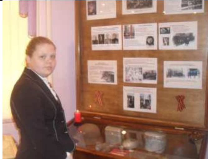
Перевозский музейно-выставочный центр. Кл. час «Я помню, я – горжусь!» 7 «а» класс