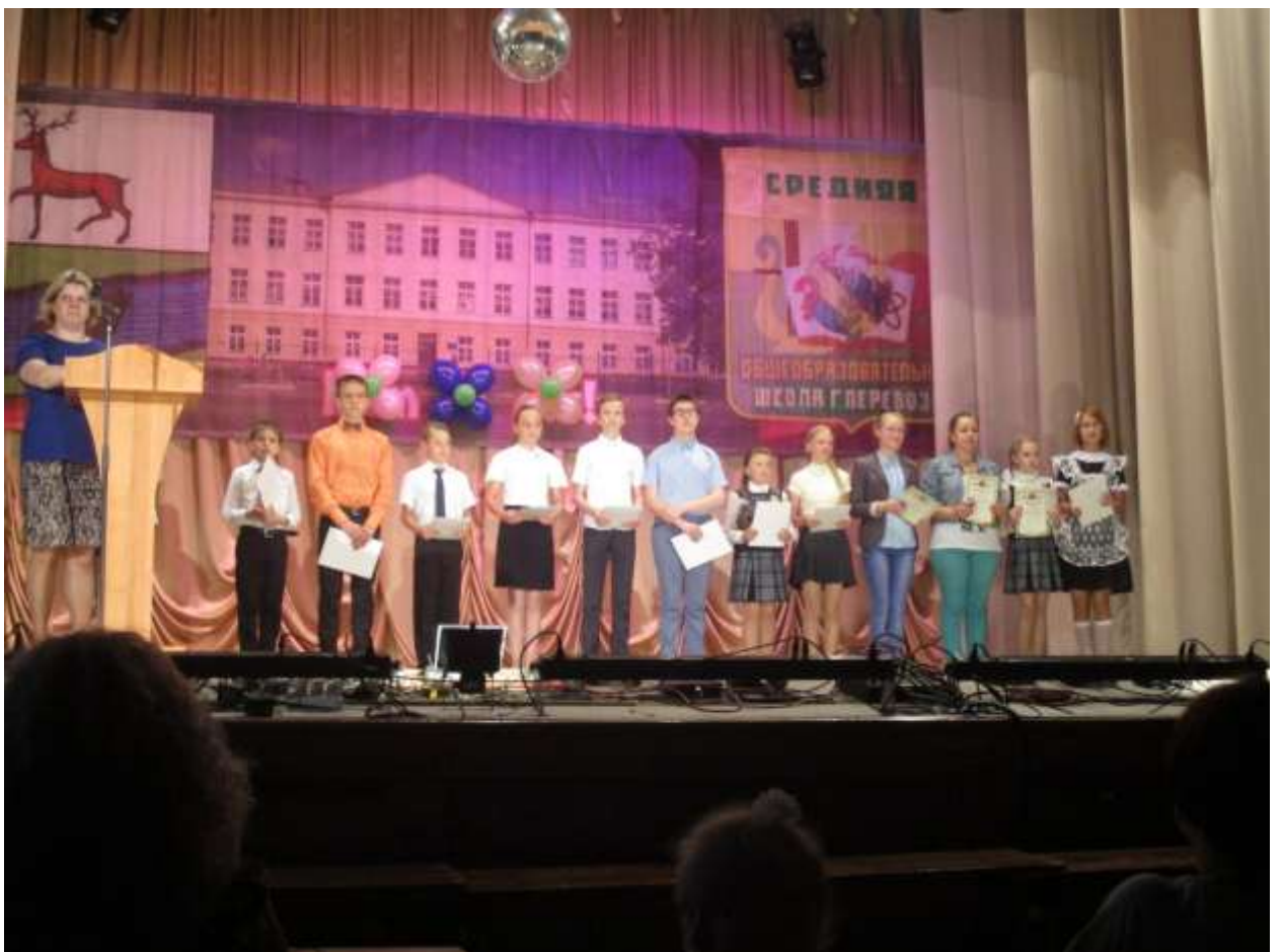
Победители школьного конкурса «Ученик года 2016»