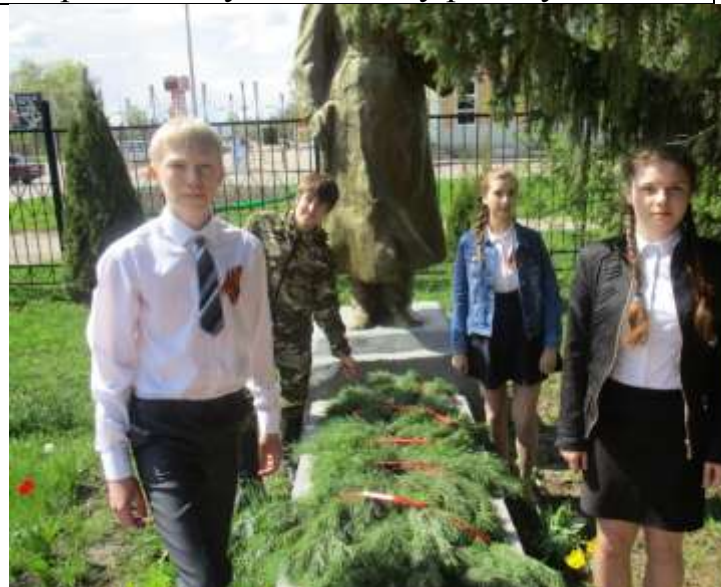
Возложение гирлянды выпускниками школы к памятнику учителям, ученикам, погибшим в годы ВОВ.