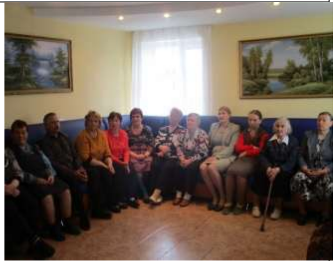
Концерт для пенсионеров в ГБУ Комплексном центре социального обслуживания населения Перевозского района Тимуровский отряд. Руководитель Ляпина М.Г. Кл. часы, посвящённые 9 мая