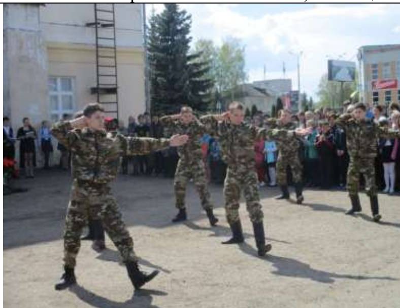
Танец «Смуглянка» - 10 «а» класс

Торжественная линейка, посвящённая Дню Победы 06.05.2016 г.