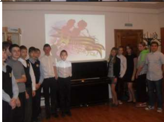
9 мая 2016 г. Демонстрация