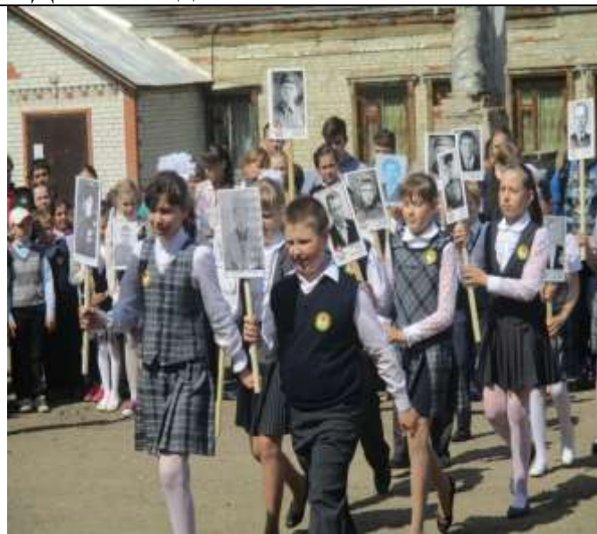
Бессмертный полк 4 «а» класс